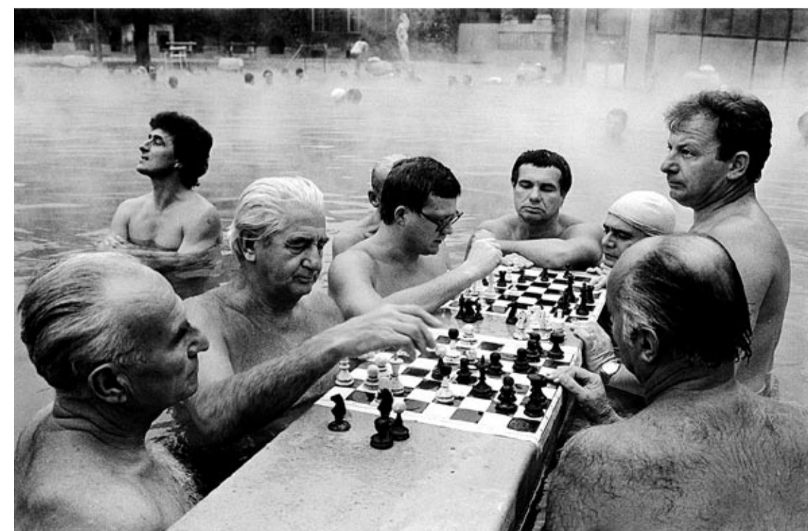
Schackspel. Budapest, 1983.