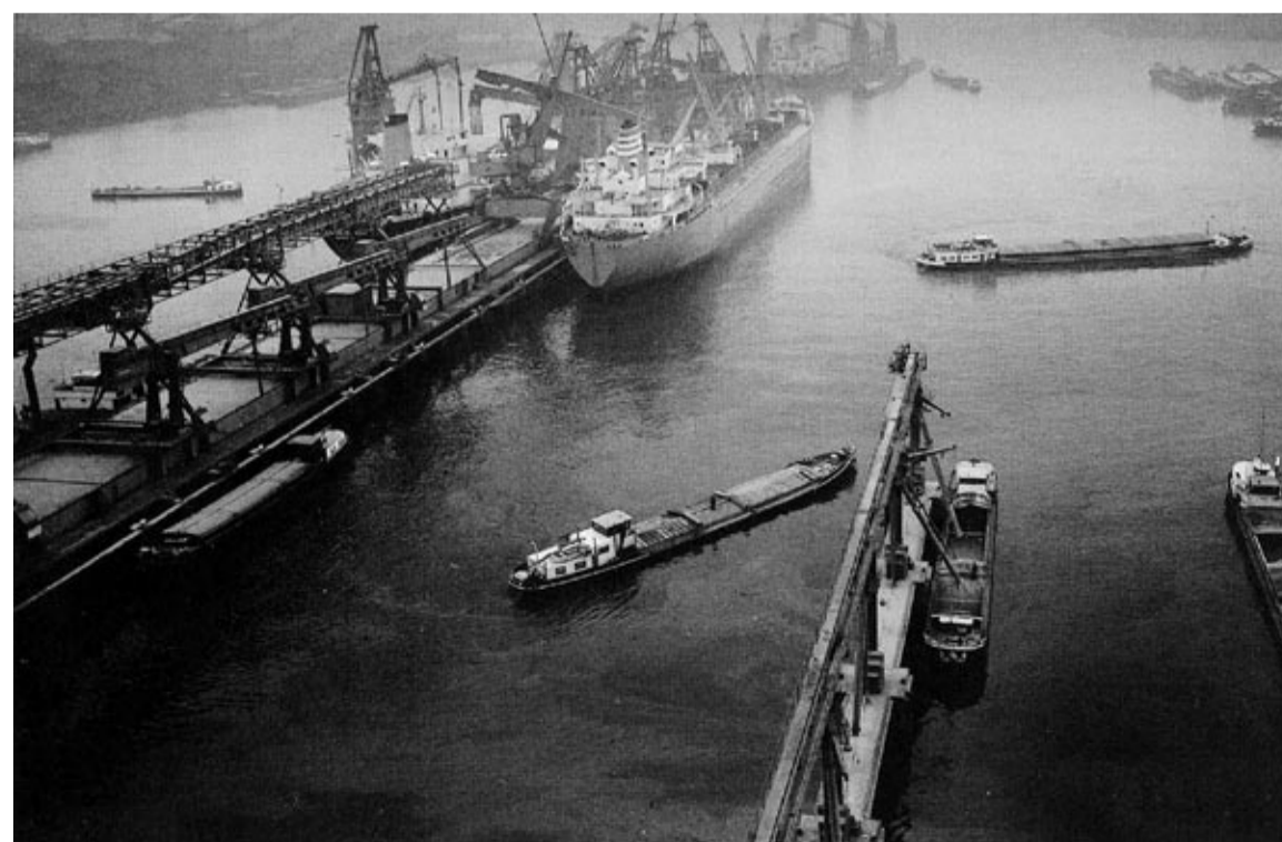
Spannmålshamnen i Botlek, Rotterdam, 1979.